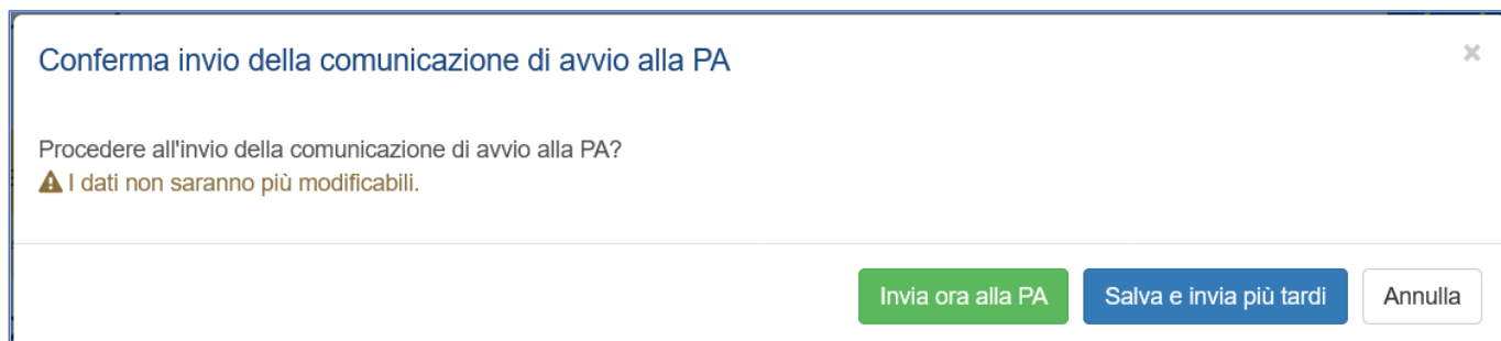
Figura 5: Il pop-up "Conferma invio della comunicazione di avvio alla PA".

Se la data di avvio è successiva alla data massima di avvio autorizzata, il pulsante "Salva / Invia" aprirà un pop-up con istruzioni su come richiedere una proroga (Figura 6) e solo l'opzione di salvataggio dei dati sarà disponibile ("Chiudi e salva dati comunicazione").