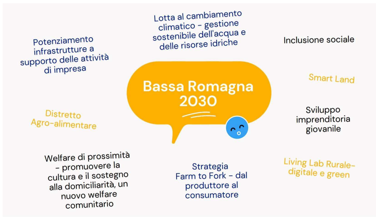
Grafico 1 - Verso una nuova visione del territorio, Bassa Romagna 2030

Sintesi grafica delle idee emerse dal percorso formativo di insitutional building "Focus EuRoPe: Percorso di Institutional Building in Romagna sulla nuova programmazione dei fondi europei", finanziato dalla Regione Emilia-Romagna nell'ambito del bando per la concessione di contributi a "Enti Locali e Associazioni, Fondazioni e altri soggetti senza scopo di lucro per iniziative di promozione e sostegno della Cittadinanza europea - anno 2020.